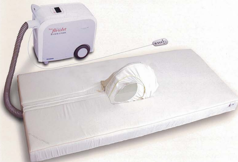
排泄物自動洗浄器 ニューフローレット エバーケア